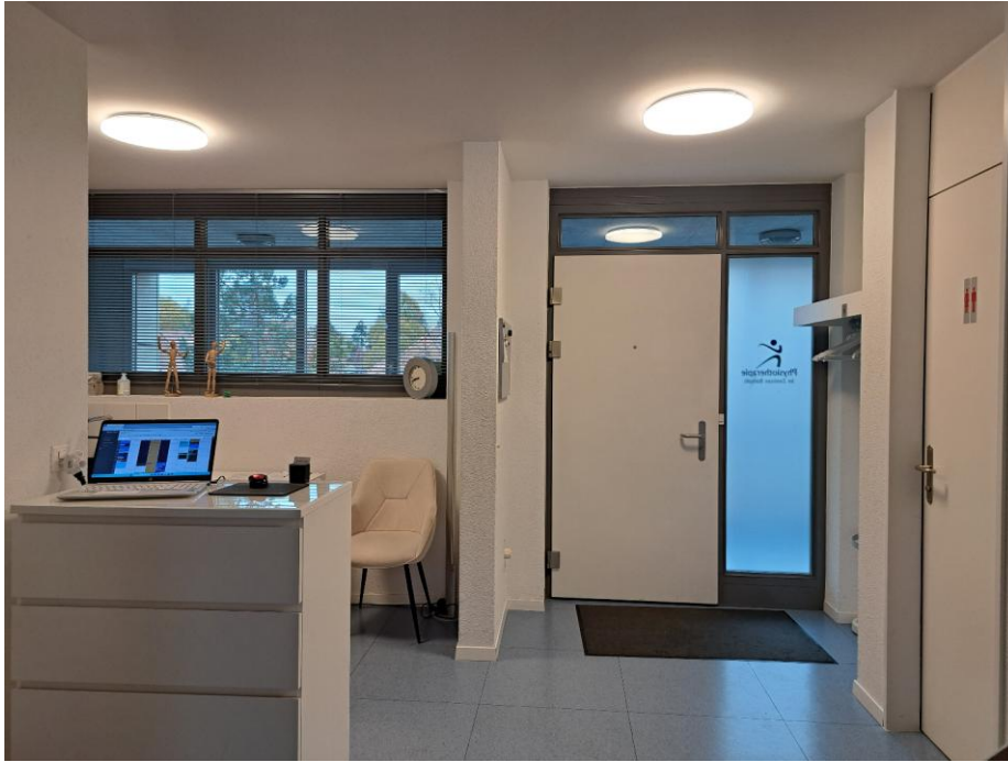
2. Obergeschoss - Blick vom Wohnzimmer Richtung Wohnungseingang