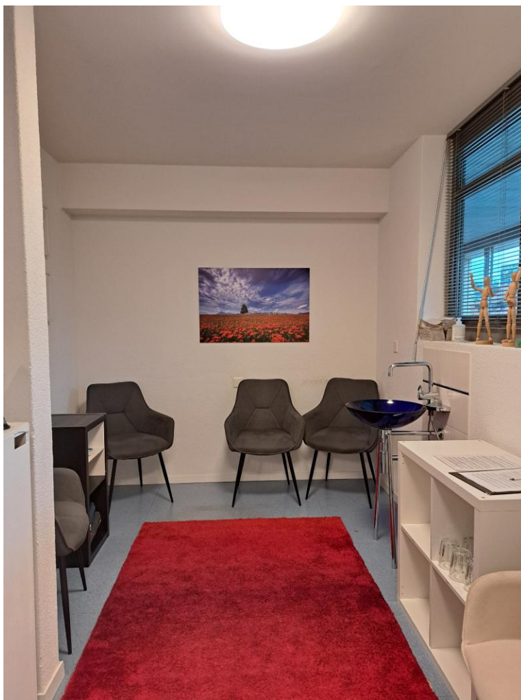
2. Obergeschoss - Aktuell Wartebereich / im Grundrissplan Bereich für Küche