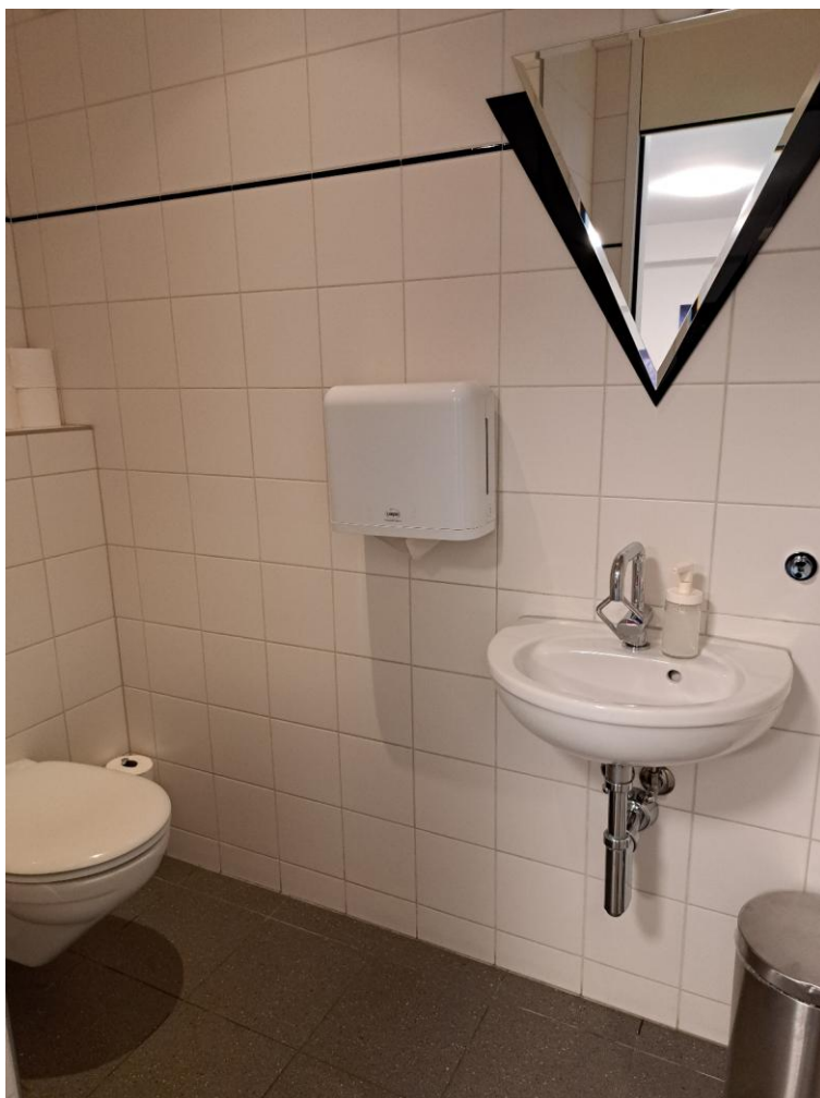
2. Obergeschoss - Separat WC