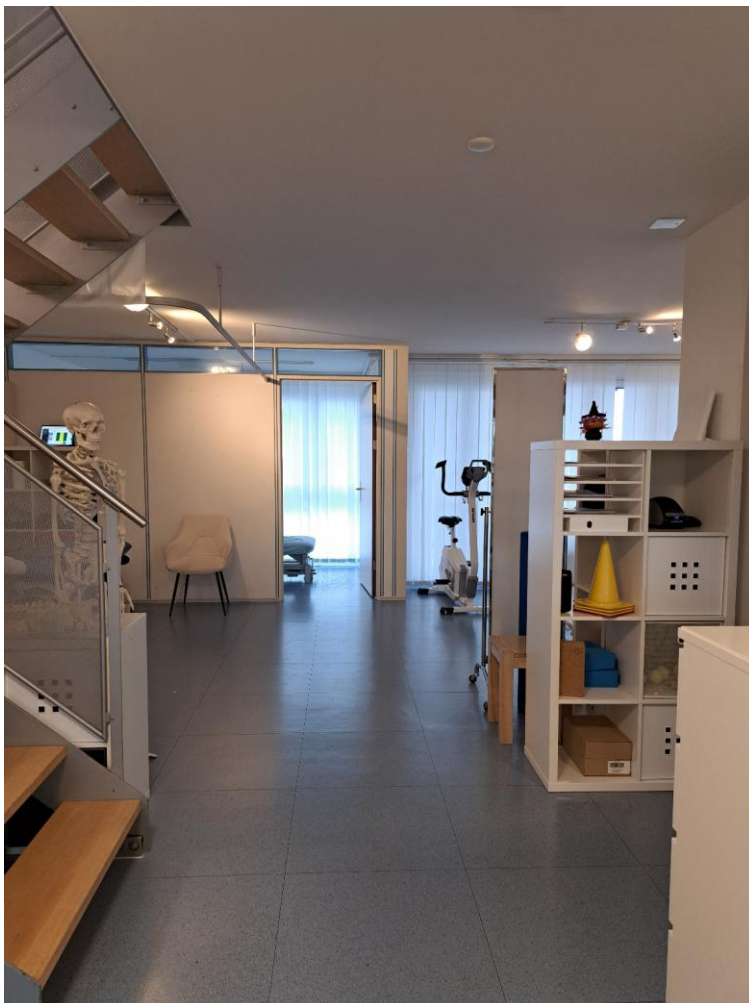
2. Obergeschoss - Blick von der Eingangstüre Richtung Wohnbereich (gem. Grundrissplan)