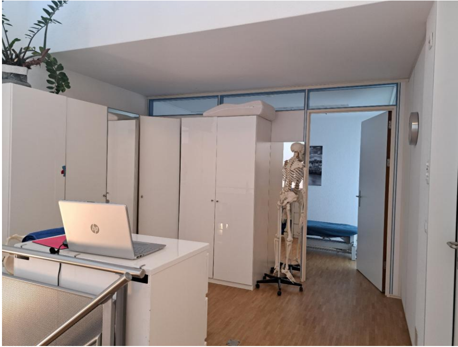
3. Obergeschoss - Vorplatzbereich vor Schlafzimmern