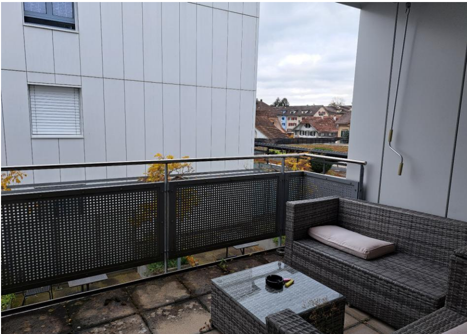
2. Obergeschoss - Balkon