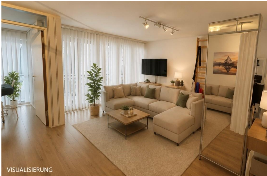
2. Obergeschoss – Wohnzimmer (Visualisierung)