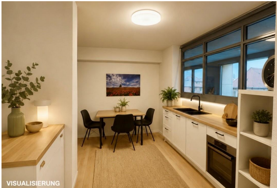
2. Obergeschoss - Aktuell Wartebereich / im Grundrissplan Bereich für Küche (Visualisierung)