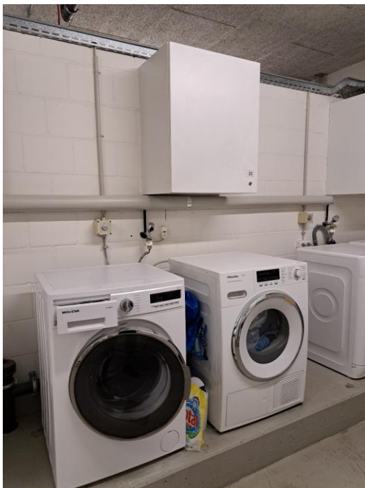
Untergeschoss - Eigene Waschmaschine/Wäschetrockner in gemeinsamer Waschküche