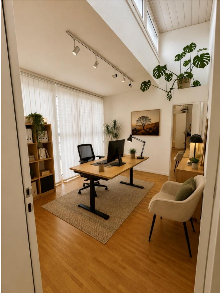
3. Obergeschoss – Behandlungsraum-Büro (Visualisierung)