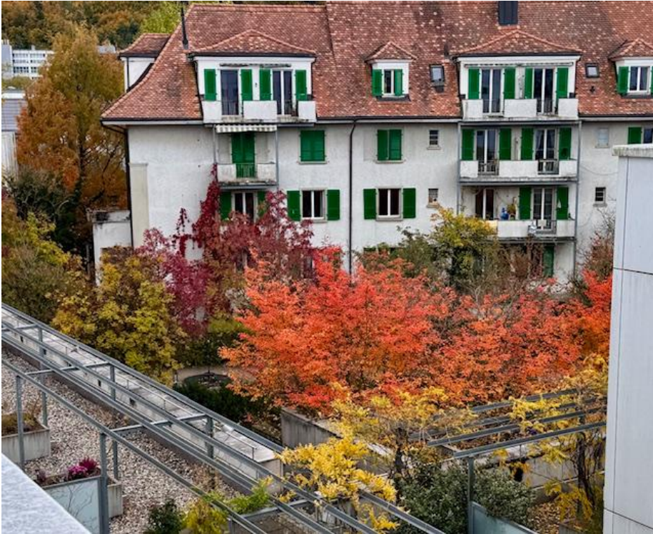
2. Obergeschoss - Blick vom Balkon