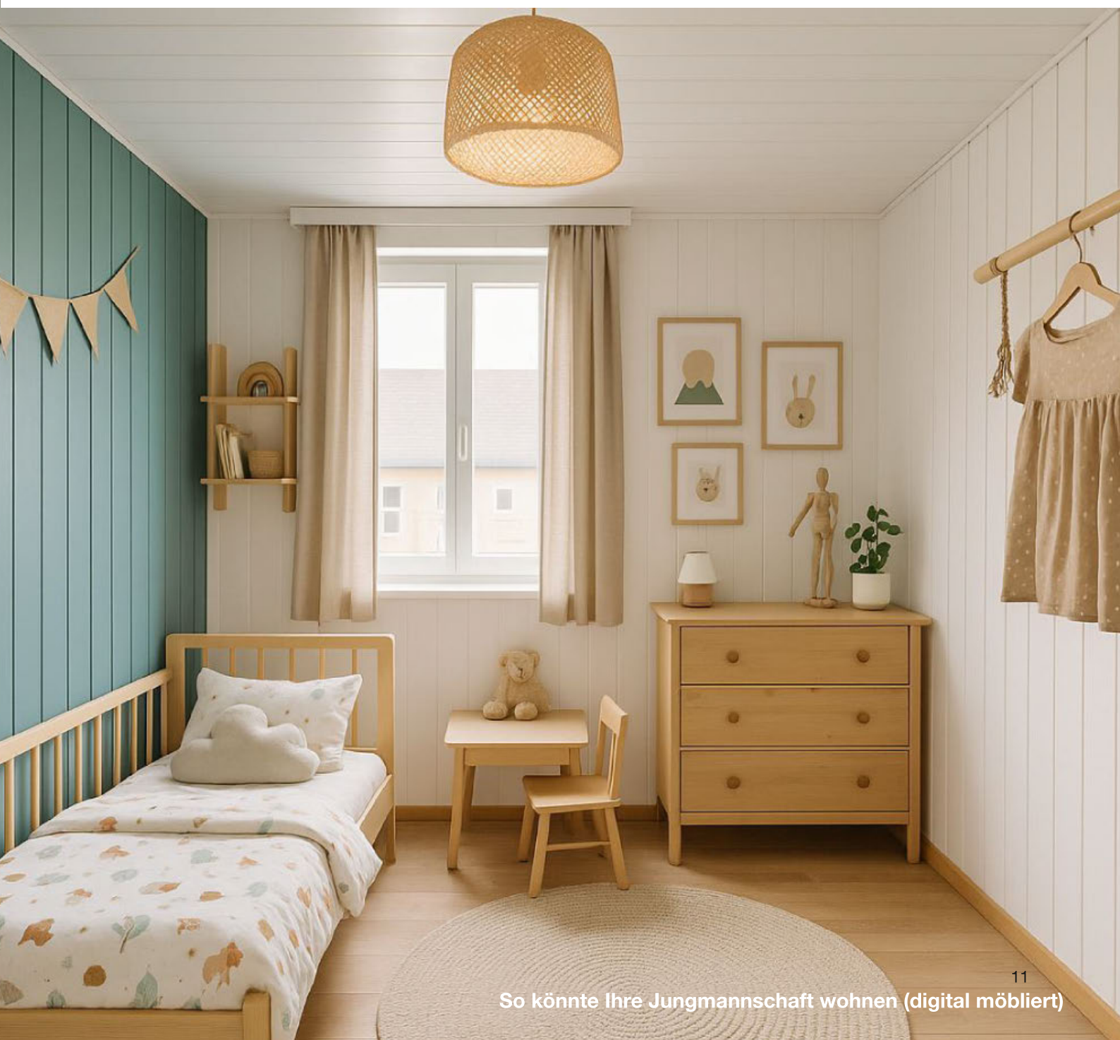
So könnte Ihre Jungmannschaft wohnen (digital möbliert)