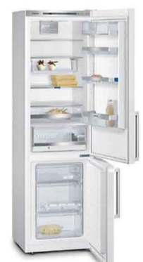
Refrigerateur intégralement encastré aussi grand que possible