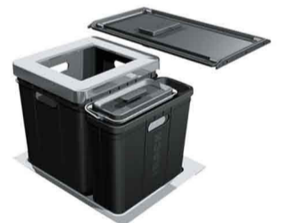
Système déchet Eisinger KEA Composta 60