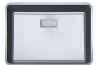
Evier Eisinger Pure-Line PUX 110 55