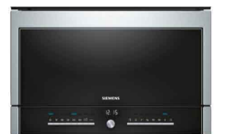
Four micro onde Siemens HF25G5L2