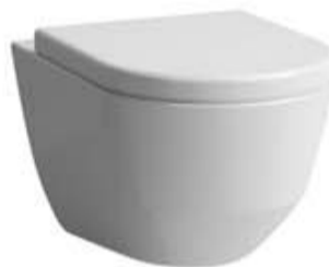
WC laufenPro Compact Suspendu