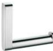
Porte papier sam-way sans couvercle