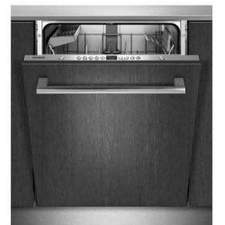
Lave-vaisselle Siemens SN65M032EU habillage dito face de meubles