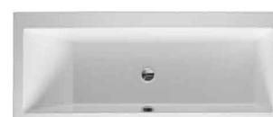
Baignoire Duravit Vero 170x75