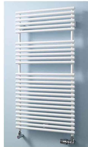
Radiateur Arbonia BT 50x115 blanc