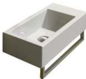
Lavabo Catalano Verso Venticinque 50 avec porte-essuie