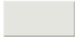
Carrelage 90 x 90 cm