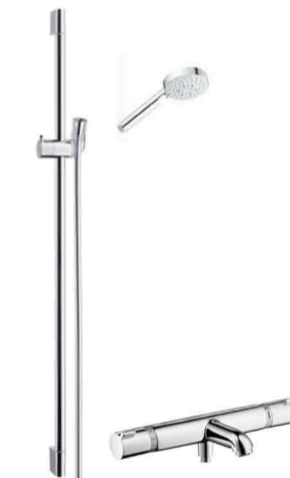
Glissière de douche 90cm Hansgrohe Unica Crometta 85 et flexible de 160 cm