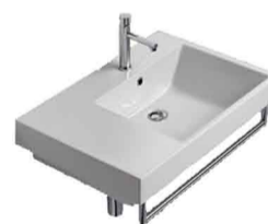
Lavabo Catalano Zero L75 avec porte-essuie