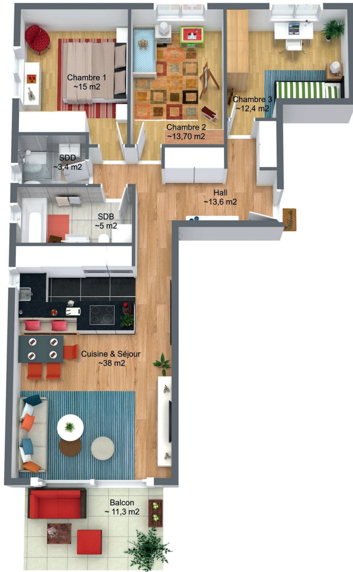
ILLUSTRATION 3D - PLAN