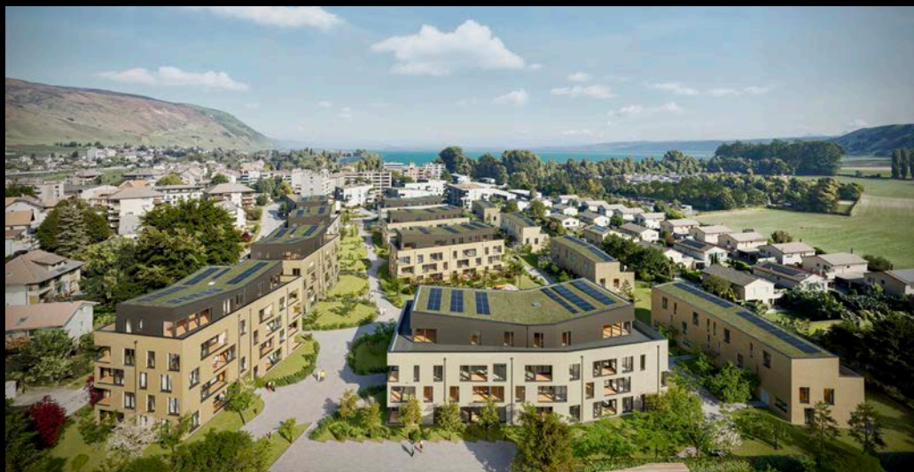
les pêches derrière l'église - le landeron