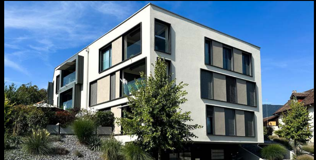
vergers 9 - cortailod