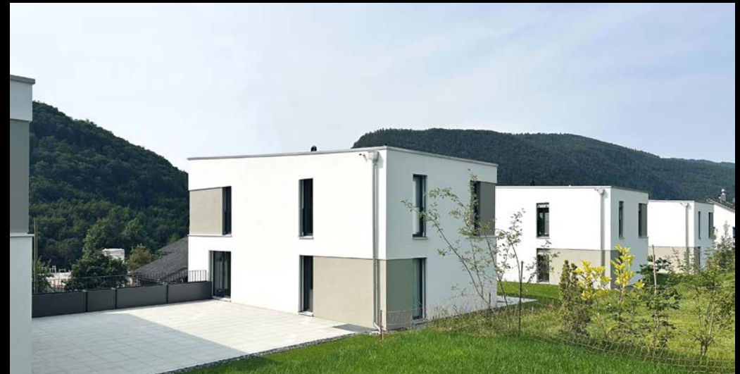
parc soleil - péry