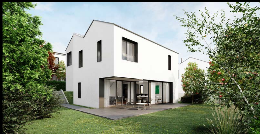
vignes-rondes - cressier