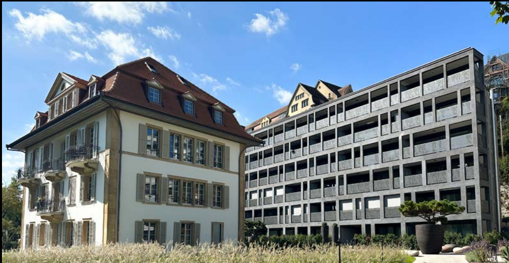
villa & parc verdan - bienne