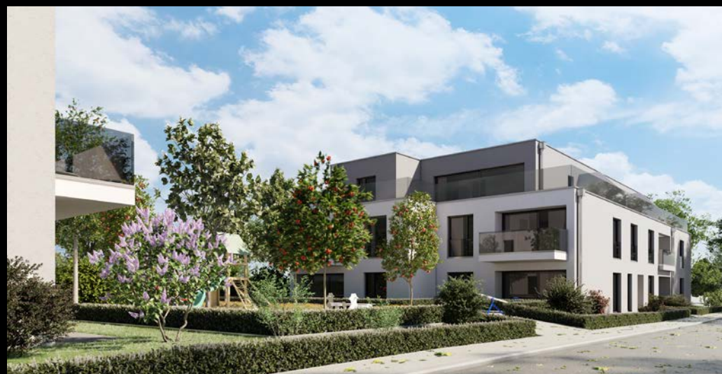
résidences île st-pierre - erlach