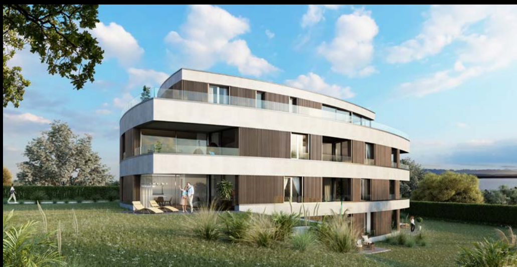
résidences du château - bevaix