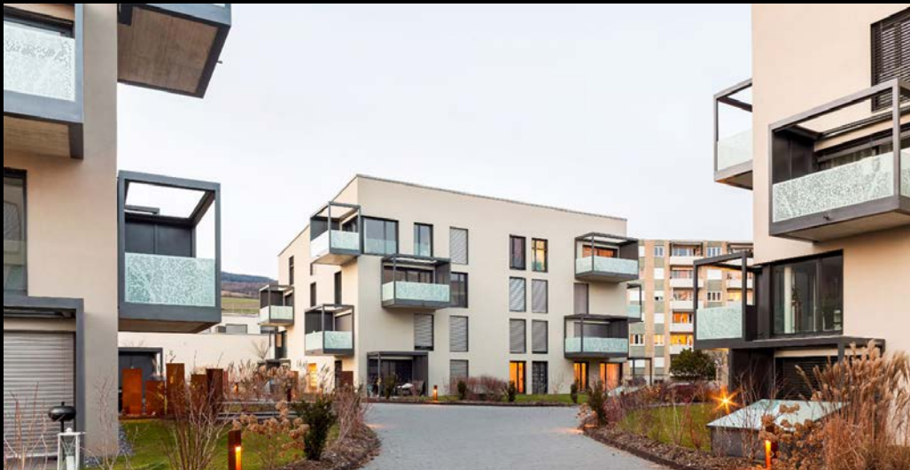
bas-du-ruisseau - le landeron